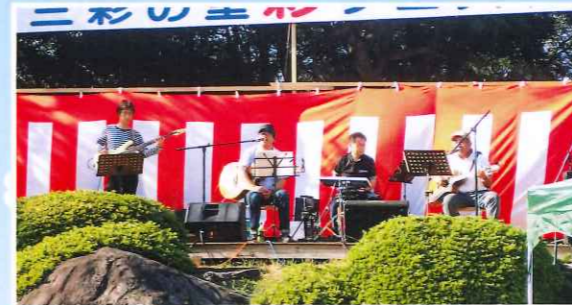
芝バンドの皆さん