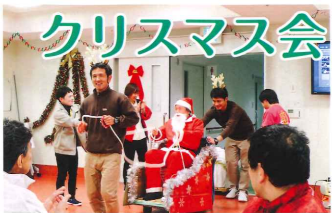
サプライズで施設長サンタが登場!