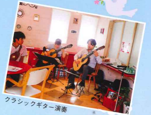
クラシックギター演奏