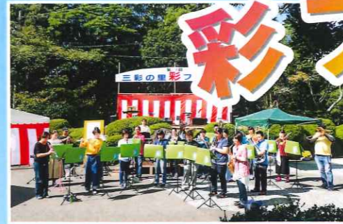
おちゃくじら with 波佐見高校の皆さん