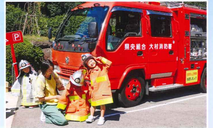
消防車の前でハイ!チーズ!!