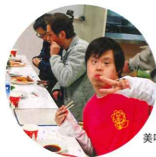
美味しい料理にみんなニコリ