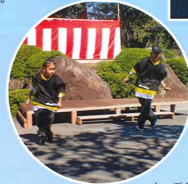
キッズダンス ILL VIBE