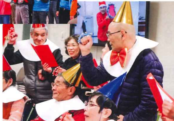
今回は生活介護が優勝しました