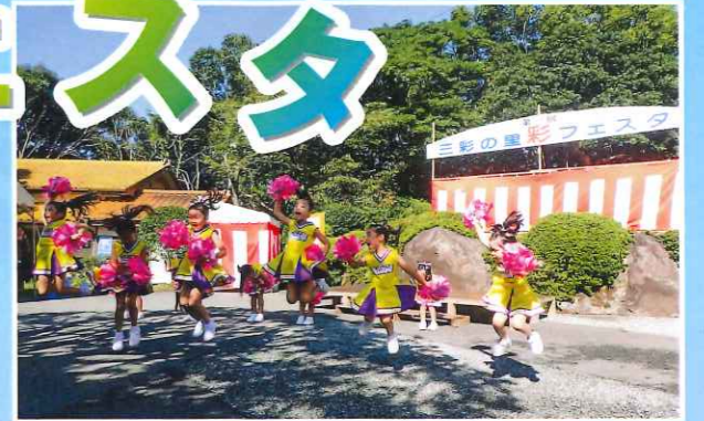
元気いっぱい!チアリーディング