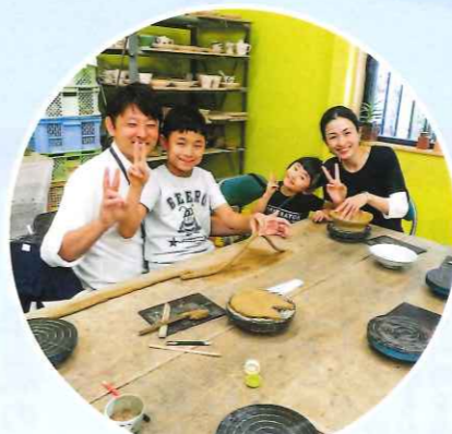
陶芸教室 どんな作品ができるかな~?