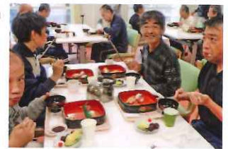
彩フェスタ慰労会の様子