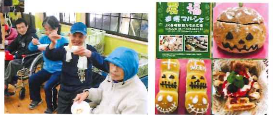
つきたてのお餅は美味しか〜 農福連携マルシェ