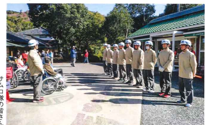
サムコ隊の皆さん