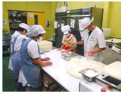
パン工房作業風景