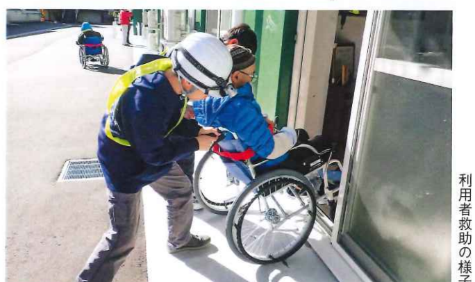
利用者救助の様子