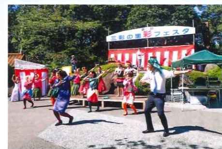
フラマキグループの皆さん

昨年は新館の建替え工事中で中止だった為、2年ぶりの開催となった今年の彩フェスタは、10月6日(出)、7日(回)の2日間開催しました。6日はあいにくの台風。強風の為テント設営は午後からとなり、予定していたステージイベントは全て中止となってしまいました。しかし、7日はお天気に恵まれ、ステージイベントも予定通り行うことができました。また、恒例の陶芸・絵付け体験コーナーでは多くのお客様にオリジナルの作品作りを楽しんで頂きました。ご来場頂いたお客様、出店・出演して頂いた皆様、ボランティアの皆様、ご寄付等頂いた皆様、本当にありがとうございました!!