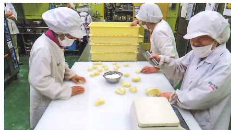
パンは「捏ね」から「焼きあげ」までを学べます。