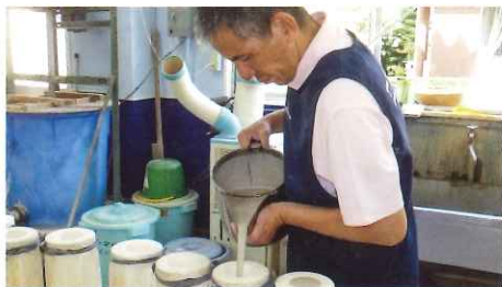
それぞれの能力に合わせた技法の習得が可能です。