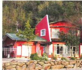
グループホームカサロッサ

利用者の自立を目指し、家庭的な雰囲気のもと地域において共同して日常生活を営むことが出来るよう適切な支援を行います。