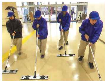
清掃(施設外作業)など様々な経験を学べます。