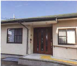
グループホームばびるす

三彩の里では広く地域の方との交流を深めるためカフェ&軽食コーナーを運営しています。